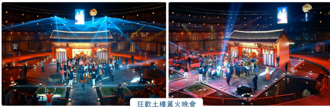
狂歡土樓篝火晚會