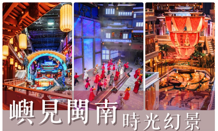
嶼見閩南時光幻景